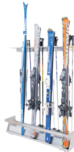
SS1400-1600 SKISTÄNDER WAND