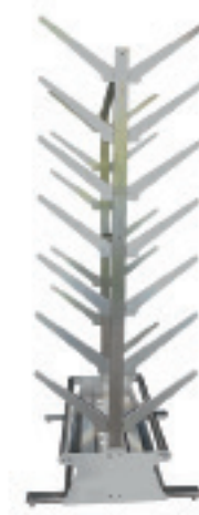
SBW14-28 SNOWBOARDWAGEN FREISTEHEND ODER AUF SCHIENEN