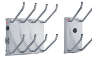
FAMILY 4 PAAR/PAIR FAMILY 2 PAAR