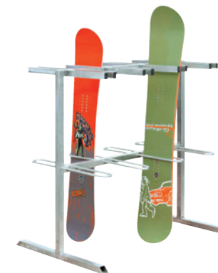
SBS1600 SNOWBOARDSTÄNDER FREISTEHEND