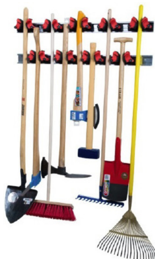
REGULAR 5 / 9