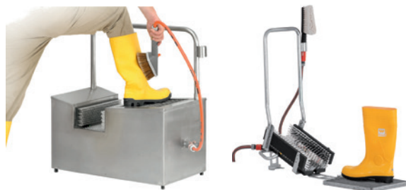
STIEFELPUTZMASCHINE/MACHINE DE NETTOYAGE DE BOTTE