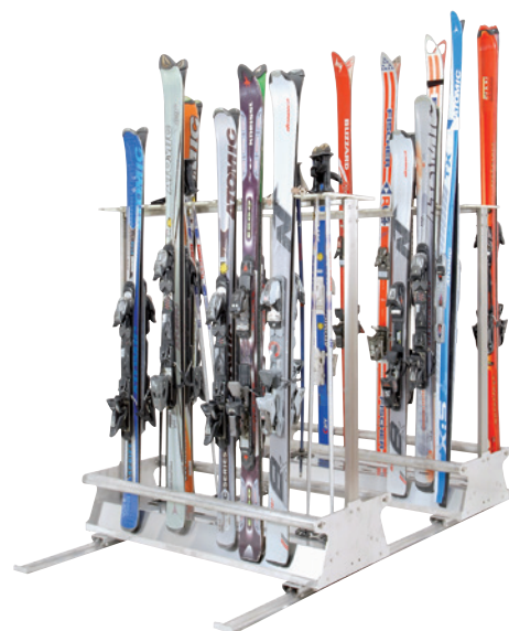
SS2800-3300 SKISTÄNDER FREISTEHEND ODER AUF SCHIENEN