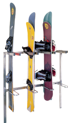
SBS800 SNOWBOARDSTÄNDER WAND