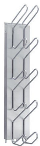
WATER 5 PAAR/PAIR