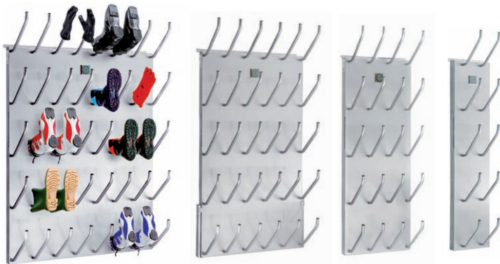
20 / 15 / 10 / 5 Paar / paires